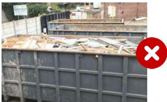
Figure 1: illustrations de tri et collecte