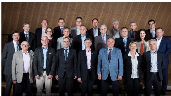
MARCHE FENETRE FRANCE

Rares sont les fabricants de portes extérieures et fenêtres dont la production est centrée sur un seul matériau. Il est temps que les organisations professionnelles ressemblent aux acteurs qu'elles représentent c'est-à-dire aux fabricants de menuiseries multi-matériaux.