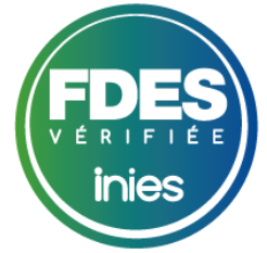
Image d'illustration, non représentative de l'ensemble des produits couverts