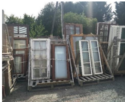
Palettes à dossier