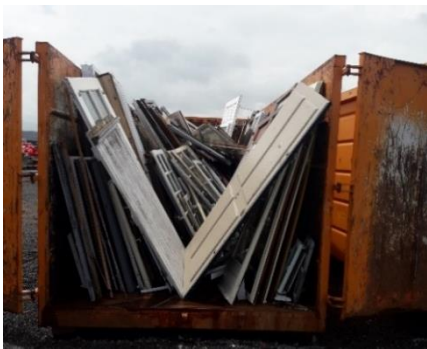
Bennes dédiées aux fenêtres

Exemples de solutions de collecte et transport de menuiseries en fin de vie :